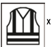
EN ISO 20471

Das neu eingeführte KWF-Prüfzeichen trägt den Schriftzug „STANDARD“. Alle Prüfobjekte - sowohl PROFI als auch STANDARD - durchlaufen eine Gebrauchswertprüfung. Alle Sicherheitsaspekte müssen in jedem Fall vollumfänglich erfüllt werden, um eines der beiden KWF-Gebrauchswertprüfzeichen zu erhalten. Das KWF-Prüfzeichen „STANDARD“ ist speziell für Produkte vorgesehen, die sich von den hohen Ansprüchen eines professionellen forstlichen Einsatzes abgrenzen. Das bezieht sich - je nach Produktgruppe - auf die verwendeten Materialien, Tragekomfort, Leistungsgewichte, Bedienkomfort und ähnliches. Die Kriterien hierfür sind für die meisten Produktgruppen bereits festgelegt. Sie werden immer wieder dem aktuellen Stand der Technik angepasst.